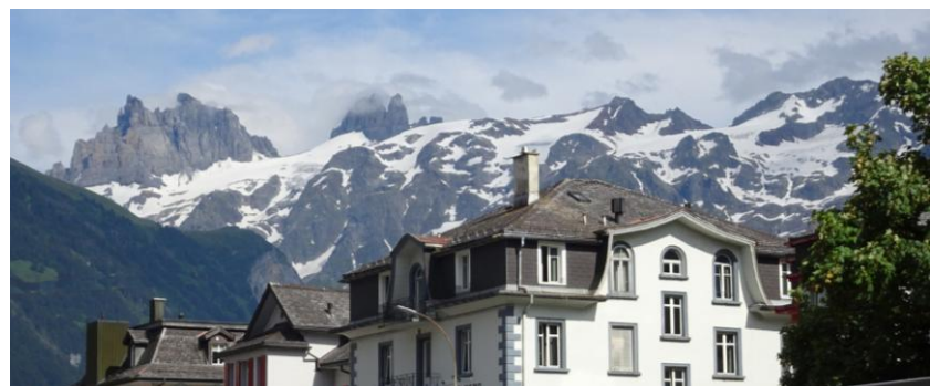
Mit den komfortablen Zügen der Zentralbahn erreicht man das Klosterdorf auf 1000 m Höhe – inmitten der 3000er