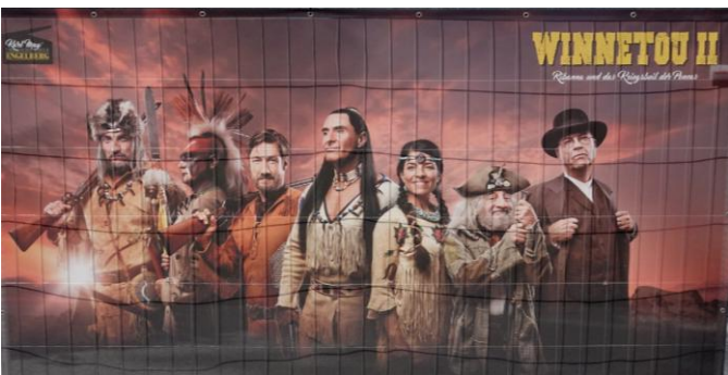
Die Helden der Geschichte

Ribanna, die schöne Häuptlingstochter der Assiniboine soll geraubt werden, Winnetou befreit sie und es beginnt eine zarte Liebesgeschichte. Mit Blutsbruder Winnetou vereiteln Shatterhand und das Kleeblatt den Überfall der Poncas auf einen Siedler Treck. Damit ziehen sie die Feindschaft von Häuptling Parranoh zu. In der schwer zugänglichen Festung von Old Firehand, setzt Parranoh den zwielichtigen Händler Rollins in ein Intrigenspiel. Es kommt zu bösen Kämpfen und Auseinandersetzungen bis auch hier das Gute zum Schluss siegt. Heiterkeit und Spannung, gefährliche Situationen wechseln sich ab. Spass für Jung und Alt sind garantiert. EE