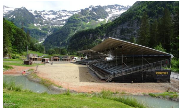
Die gedeckten Tribünen 1 und 2