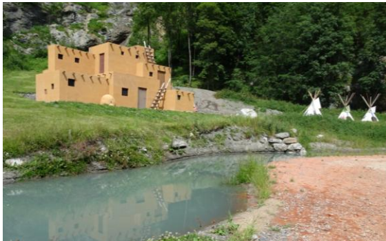
Das Tipi der Indianer