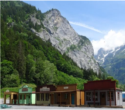
St. Louis und New Venago in Engelberg